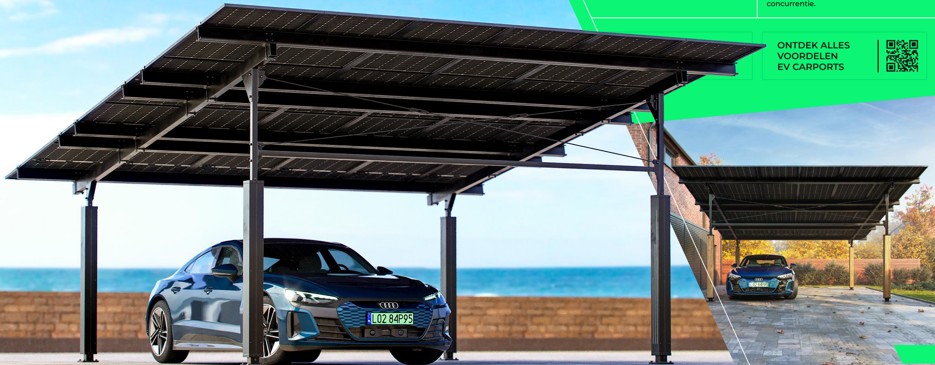
EV_01_PREMIUM_PLUS (stalen palen, stalen lamellen)